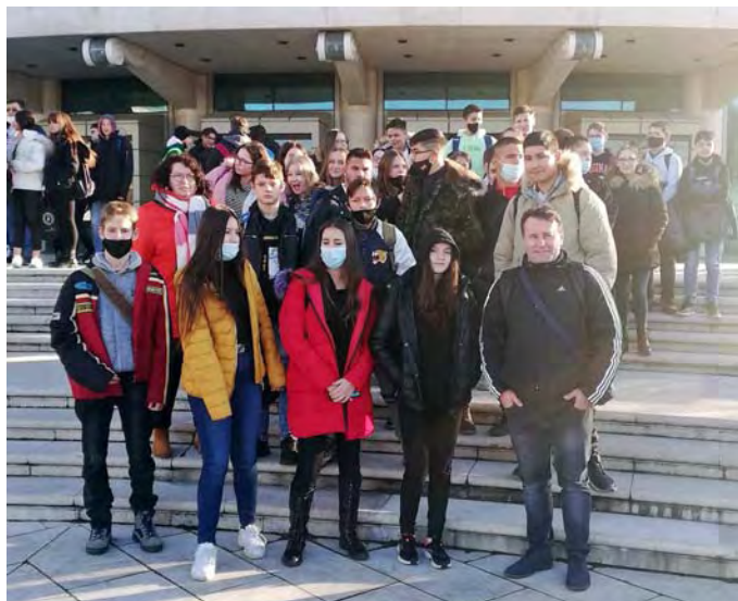
Nyolcadikosaink a Nemzeti Színháznál

A Lázár Ervin Program keretében a nyolcadikos évfolyam tanulói Budapesten a Nemzeti Színházban a János vitéz című előadását tekintették meg. Az előadást ötödikben egy másik pályázat keretében már láthattuk, de ez nem szegte kedvünket, sőt, tudjuk, minden előadás más, így örömmel készültünk a színházlátogatásra.