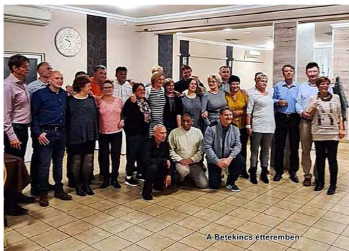
A Betekincs étteremben

A találkozó – a járványhelyzet miatt – a Művelődési Házban került megrendezésre, majd a Betekincs étteremben folytatódott vacsorával.